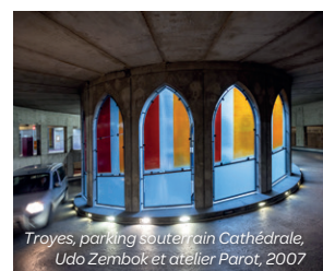
Troyes, parking souterrain Cathédrale, Udo Zembok et atelier Parot, 2007