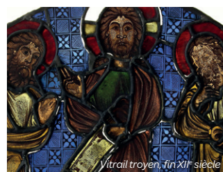
Vitrail troyen, fin XII e siècle