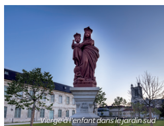
Vierge à l'enfant dans le jardin sud