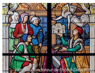
Vitrail du fondateur de l'hôtel-Dieu, 1866